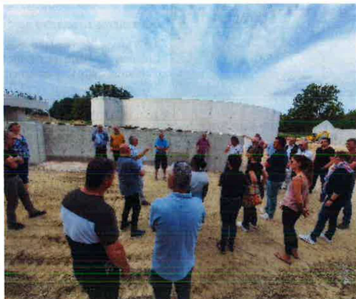
VISITE DU CHANTIER DE LA NOUVELLE STATION D'ÉPURATION DE SESENHEIM

La mise en service de la nouvelle station « Argile & Moder » interviendra à la fin de l'année 2022 avec la mise en service de la file eau. La mise en route de la file boue interviendra au premier trimestre 2023.